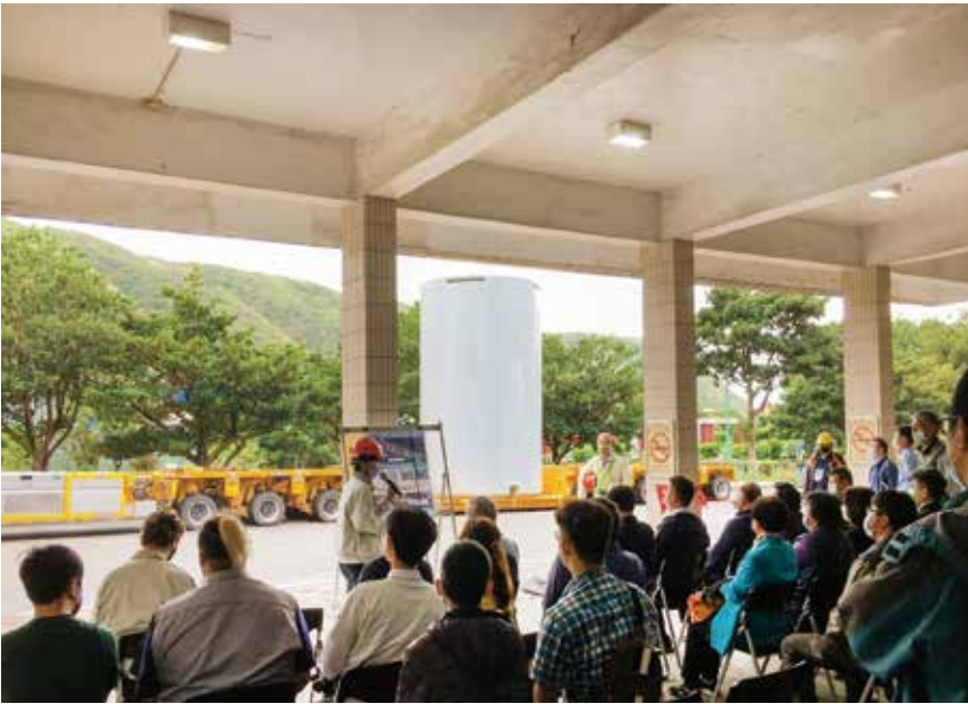
圖七、每年「核一廠除役及乾式貯存訪查活動」，多軸油壓板車以時速兩公里左右，模擬「混凝土護箱移動及運送」作業。（圖片來源：給核廢一個家粉絲專頁）