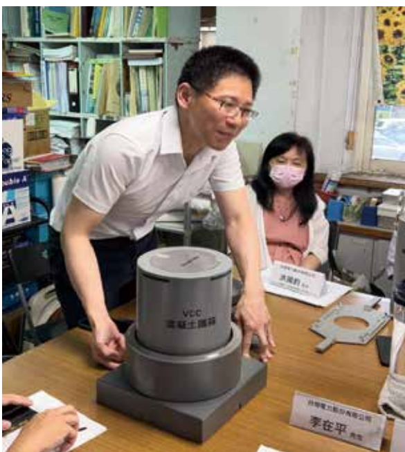
圖六、混凝土護箱移動至乾式貯存場固定後，會再多混凝土外加屏蔽，讓輻射可以再低一點。混凝土護箱和外加屏蔽裡面都有空氣通道（台電人員雙手指的地方），完全是靠自然對流，繼續降低核廢燃料棒的溫度。

環盟：你不是用在水裡的時候裝好，然後之後吊上來，那吊上來，你的工作平台，然後插室焊接之後，再吊到那個嗎？你好像少說了一個吊到平台上嘛？