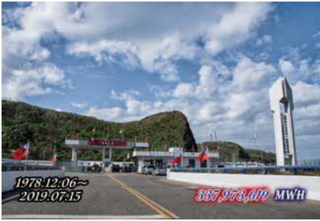
圖八、現在有總統候選人主張核能延役，包括核一都要再重啟，但是發電機裡面的線圈，停五年未進行任何氮封或乾燥空氣封存，台電人員認為這5年來，相關發電系統維護保養都沒做，所以這個機組要上來，不是說不可能，但是非常困難。

台電：基本上，現在核一已經除役了，現在有總統候選人主張核能延役，包括核一都要再重啟，但是發電機裡面的線圈，停5年未進行任何氮封或乾燥空氣封存，再使用有其困難。