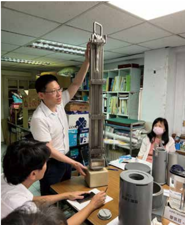
圖三、台電帶來的這根核燃料棒是真實燃料的尺寸，只是為方便攜帶，高度被縮短，真實的高度為 146 英吋（約 370.84 公分）。