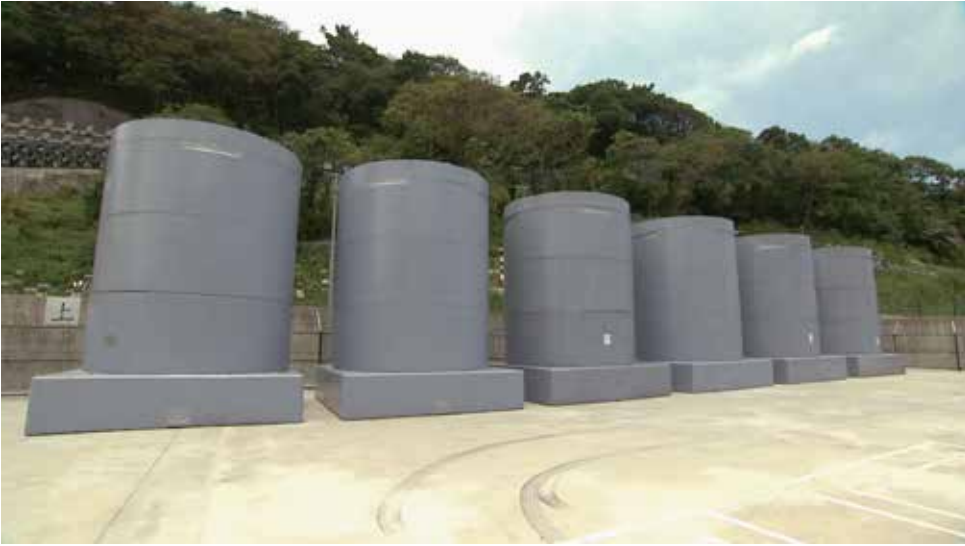
圖五、核一廠的室外乾式貯存廠因新北市政府拒絕核發「水土保持完工證書」而無法申請運轉執照已經有十年之久。

放射性，因為它還沒有打死，它放射性不強，半衰期很長，是它分裂之後的那個東西的半衰期比較短，那個放射性就很強。