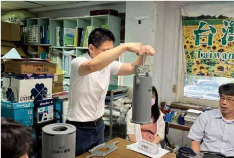
圖六、台電人員用模型解說核廢燃料棒從冷卻池中裝入乾式貯存筒後，再裝入傳送護箱，屏蔽上蓋封焊之後吊掛起來要送到已經放在多軸油壓板車上的混凝土護箱中。