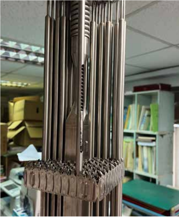
圖四、這個是核一跟核二沸水式的燃料的模型近照，用鈳合金的燃料護套，裡面就是燃料，有看到那個一顆一顆的，就是燃料丸。

反應，一旦濃縮鈾 (U-235) 的用完了，還有 95% 是原來自然的鈾，剩餘部份可以回收再利用，也就是可以把它濃縮到可以進行核分裂，它的能量 (產生率) 不是像原子彈那個，原子彈是接近百分之百濃縮的，所以原子彈一炸，瞬間能量很大。但核能電廠的能量是可控的，一般來講這 4% 濃縮鈾的核燃料大概在反應爐裡面會燒 5 年，燒完後退出來，我們就把它叫做用過核燃料。