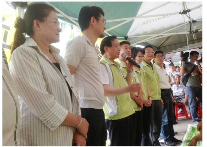
2013/8/5 立法院24小時佔據主席台連續5天·反核立委到院外與靜坐民眾說明