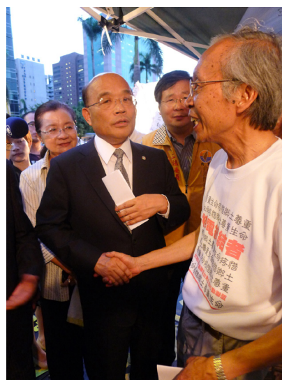
2013/8/5 施信民創會會長在立法院外反核靜坐，下午6時立法院朝野協商後決定第二次臨時會不會審核四公投後，民進黨蘇貞昌主席到立法院外告知立法院內情況