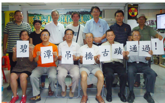
2013/8/13 碧潭吊橋古蹟通過餐會