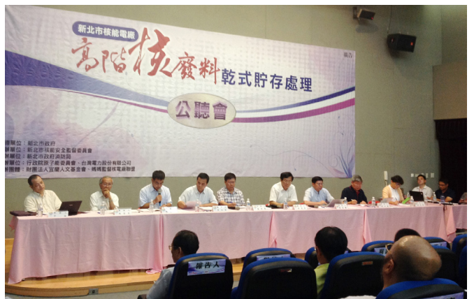
2013/8/11 環保聯盟參與新北市政府核安監督委員會主辦之核廢料乾式貯存公聽會