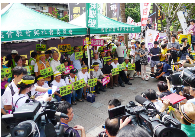
2013/8/2 主張立法院應立即停建核四不要通過扭曲民意的國民黨版核四公投記者會，記者會後開始24小時反核靜坐到8/5