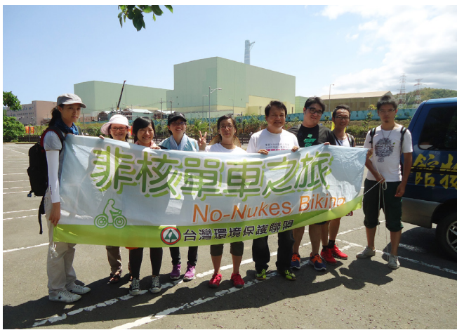
2013/8/10 貢寮非核單車之旅