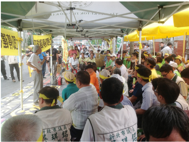
2013/8/5 立法院外立即停建核四靜坐